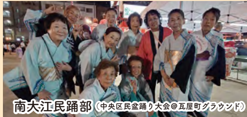
南大江民踊部 (中央区民盆踊り大会@瓦屋町グラウンド)

南大江女性会は多くの地域活動に参加・協力しています。地域での仲間づくりのため、これからも新しい会員さんの入会をお待ちしています。