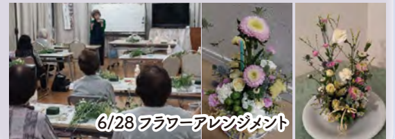
6/28 フラワーアレンジメント

今後の予定 10月25日 (土) フラワーアレンジメント 11月29日 (土) 寄せ植え