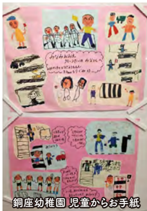
銅座幼稚園 児童からお手紙