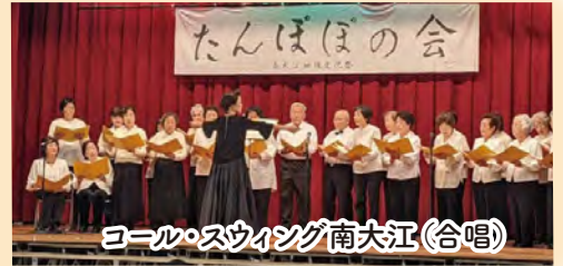
コーラスウイング南大江(合唱)