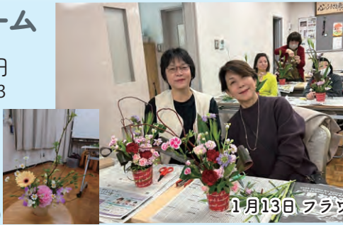
1月13日、フラワーアレンジメント