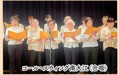
コーラスウイング南大江(合唱)